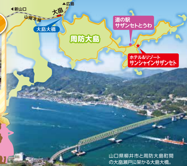
山口県柳井市と周防大島町間の大島瀬戸に架かる大島大橋。

■営業時間 / 10:00~18:00 ■定休日 / 毎週水曜日(祝日の場合は翌日) ■TEL.0820-78-0033