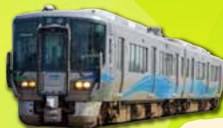
あいの風とやま鉄道