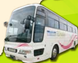
加越能バス わくライナー