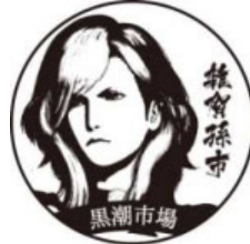
(和歌山マリーナシティ 黒潮市場)