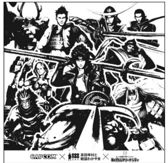
和歌山マリーナシティ ポルトヨーロッパ