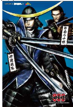
(参加賞 ポストカード3枚セット)