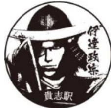
(和歌山電鐵 貴志駅)