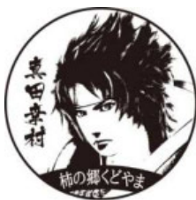
(道の駅 柿の郷くどやま)