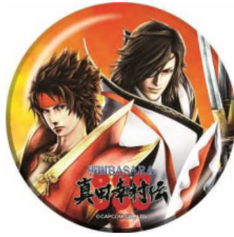
(完全制覇賞 オリジナル缶バッジ2個セット)