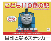
目印となるステッカー

地域の子どもたちにとって安全な環境づくりに貢献するために、日本民営鉄道協会と連携して、「こども110番の駅」を実施しています。目印となるステッカーを見て駅に助けを求められた場合、子どもを保護し、必要により子どもに代わって110番通報などを行います。