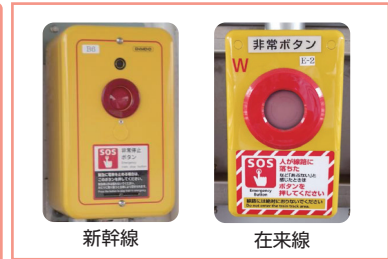
ホーム非常ボタン