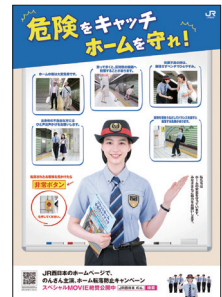
ホーム転落防止キャンペーンのイメージキャラクターの「ん」さんを起用したポスター