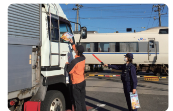
踏切事故防止キャンペーン

また、自動車学校の講師の方や学校の教職員の方に向けての啓発活動、テレビCMの放映や車内ポスターの掲示などにより、あらためてルールを守ることの大切さを伝える取り組みも実施しました。